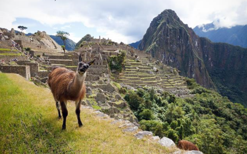
Machu Picchu, Peru