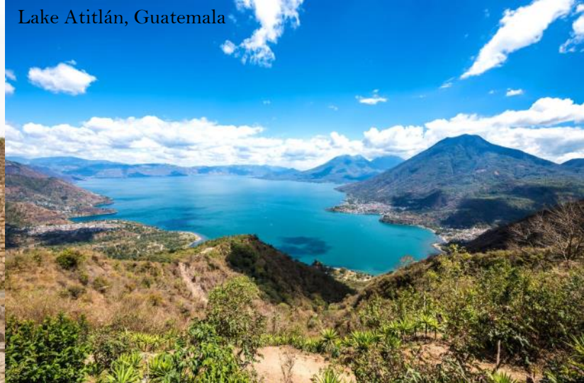
Lake Atitlán, Guatemala